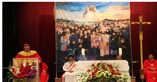
Vietnamese Catholic Community gathered at B.C. High on November 26th for the feast of the 118 Martyrs

Need a daily reminder of the Reason for the Season? Prepare for Christmas by following Fr. Anthony's blog during this Advent Season. I will be offering frequent (may not be every single day...but I'll do my best) posts on the daily readings or some other aspect of Advent. This is a simple and easy way to do something extra for the Advent season, so I hope you will! My blog is: manofcloth1.blogspot.com